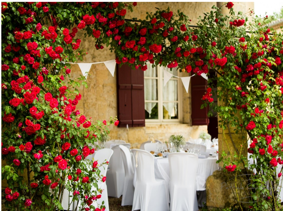
Sous les colonnes du préau