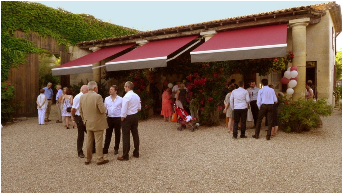
Cocktail sous le préau