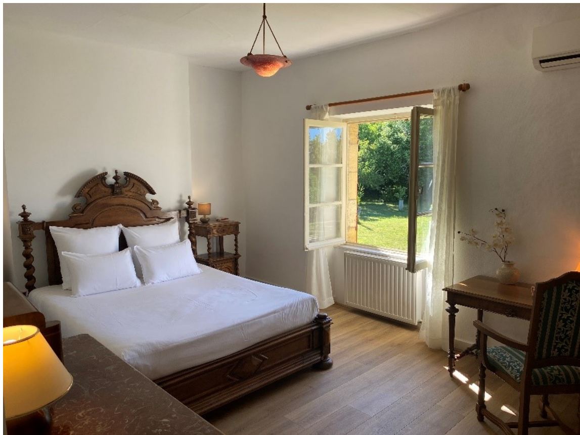
Chambre Le Fournil lit Queen size