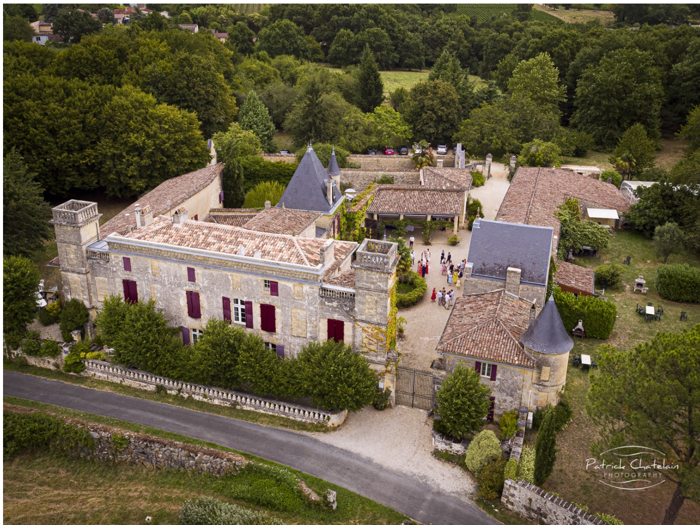
Vue d'ensemble du château Sentout