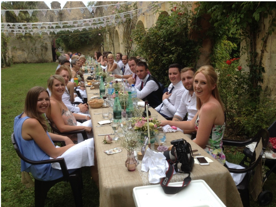
Dans les arcades du Cloître