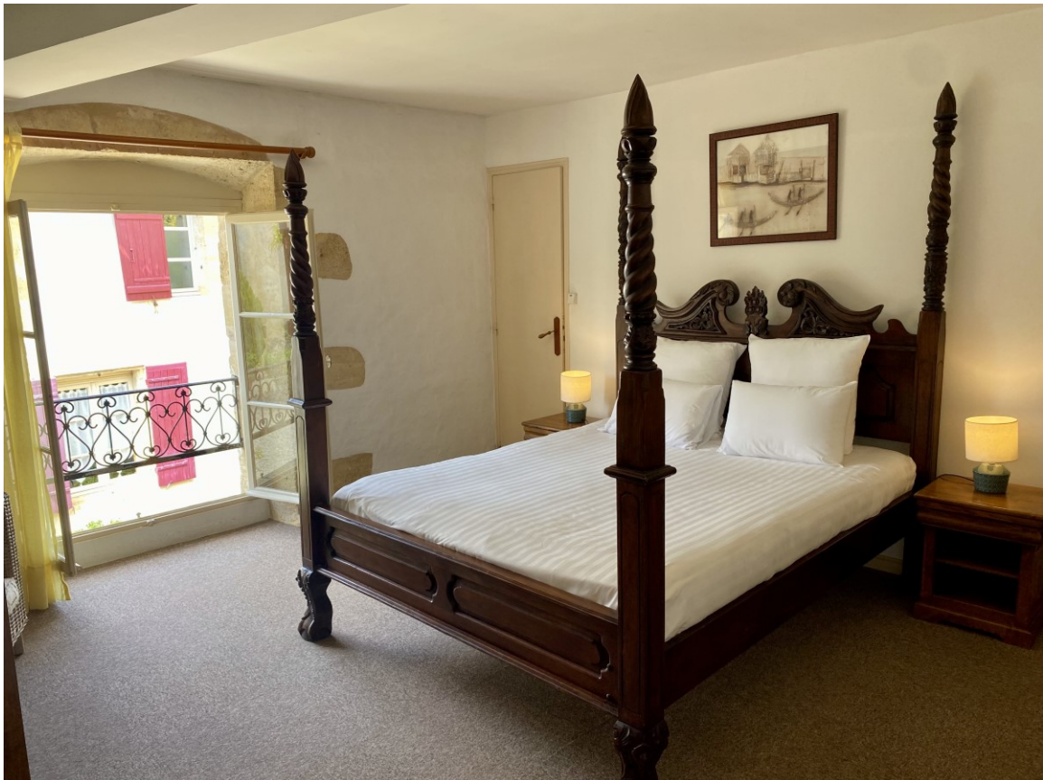
Tilbury lit king size