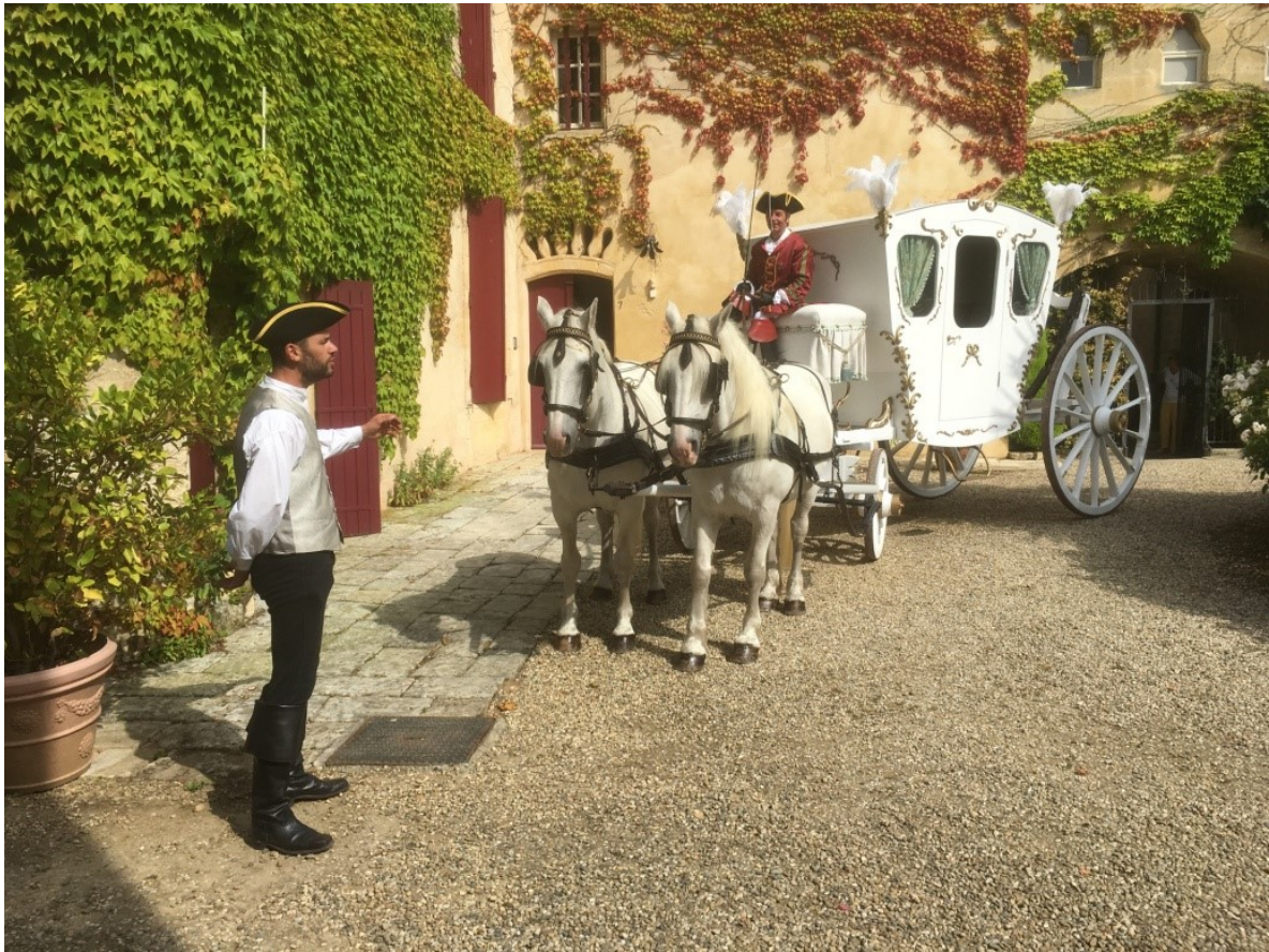
La mariée arrive