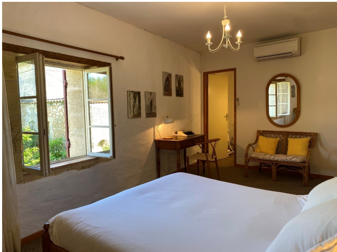
Chambre Le Pressoir lit Queen size