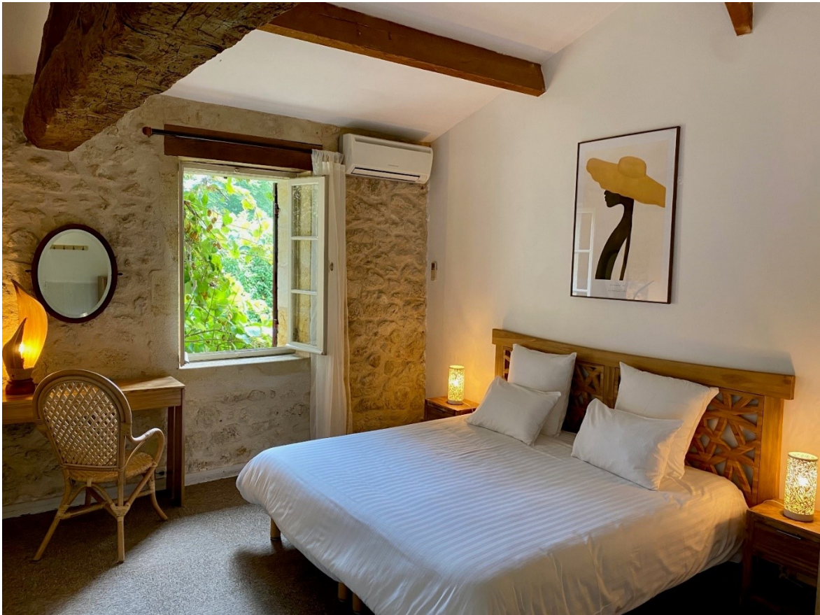
La Remise, lit kingsize