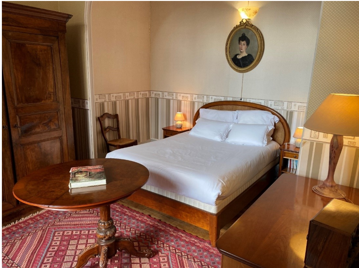
Chambre La Tuilerie