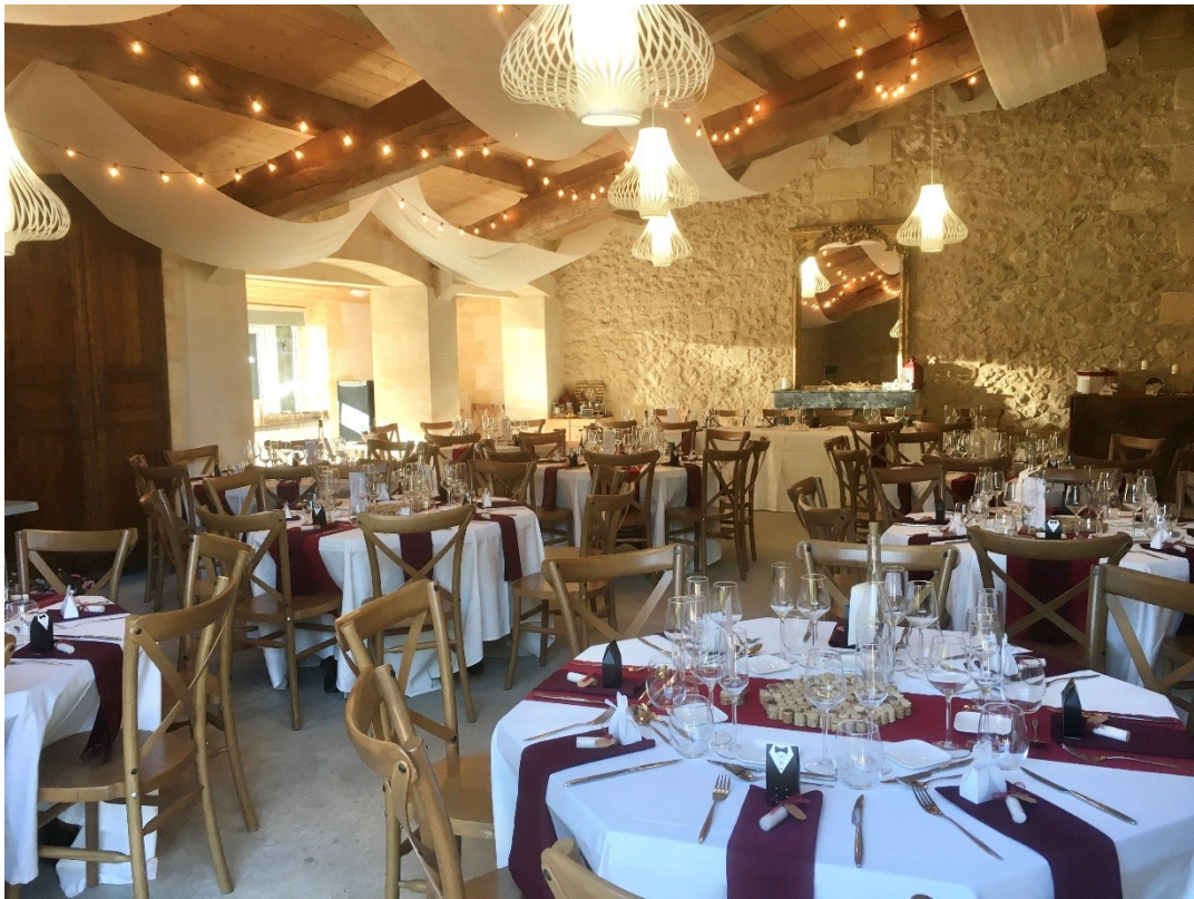
Dîner dans la salle La Grange