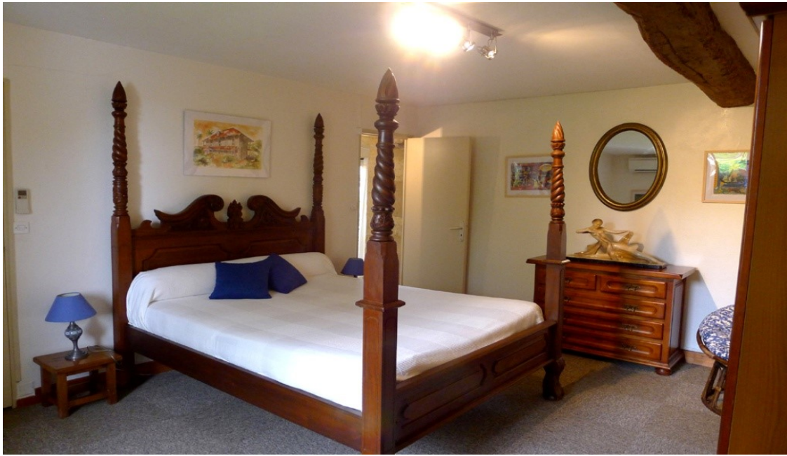
Chambre La Remise lit King size