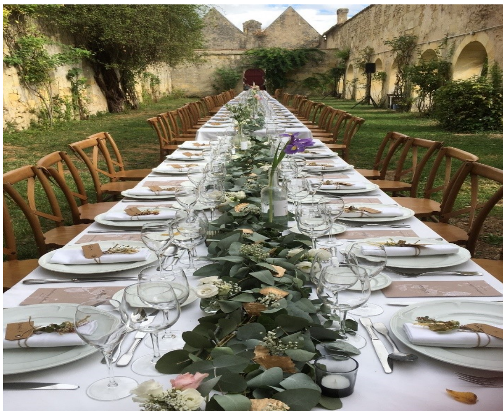
Diner dans le cloître