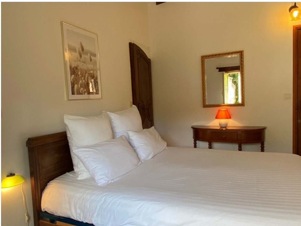
Chambre La Roseraie lit Queen size