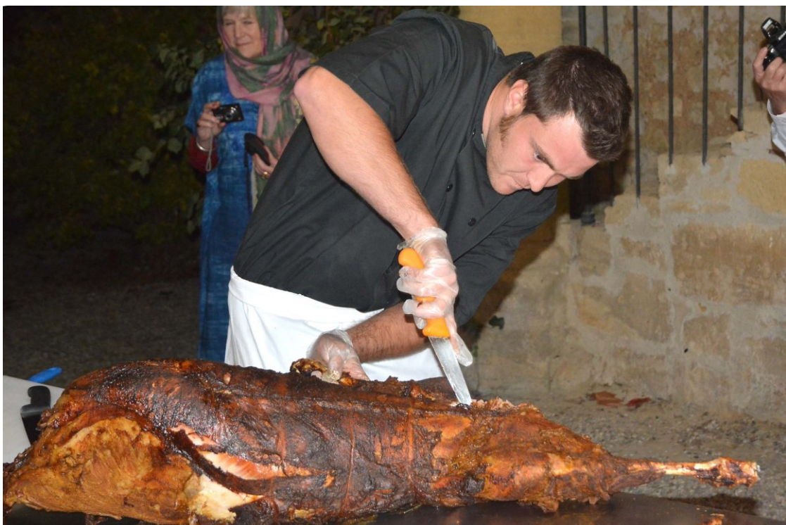
Méchoui ou cochon de lait