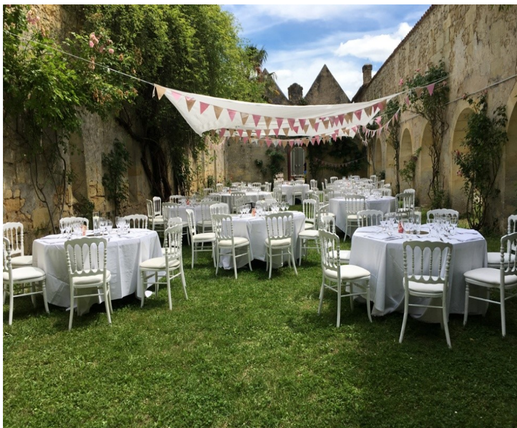
Dans le Cloître