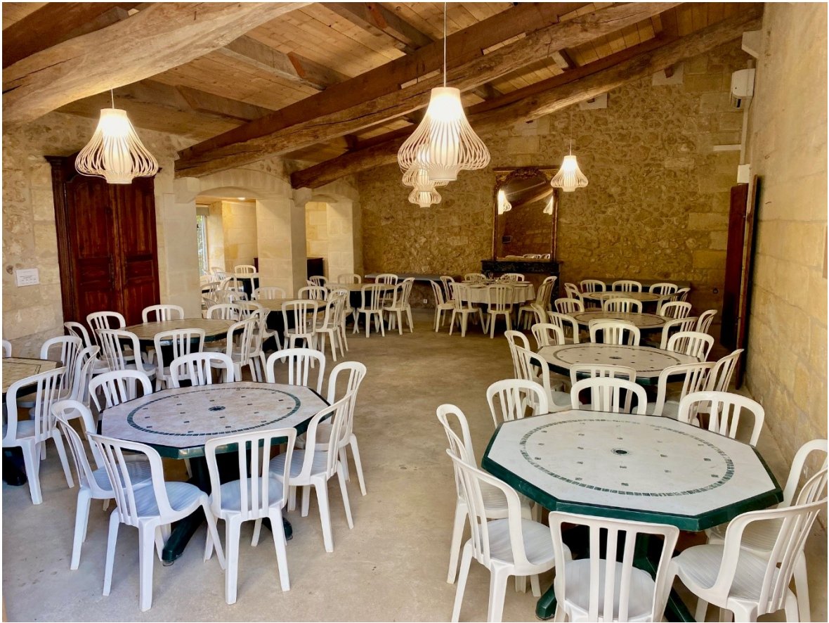
Préparation pour 100 couverts (en attente de nappes et couverts)