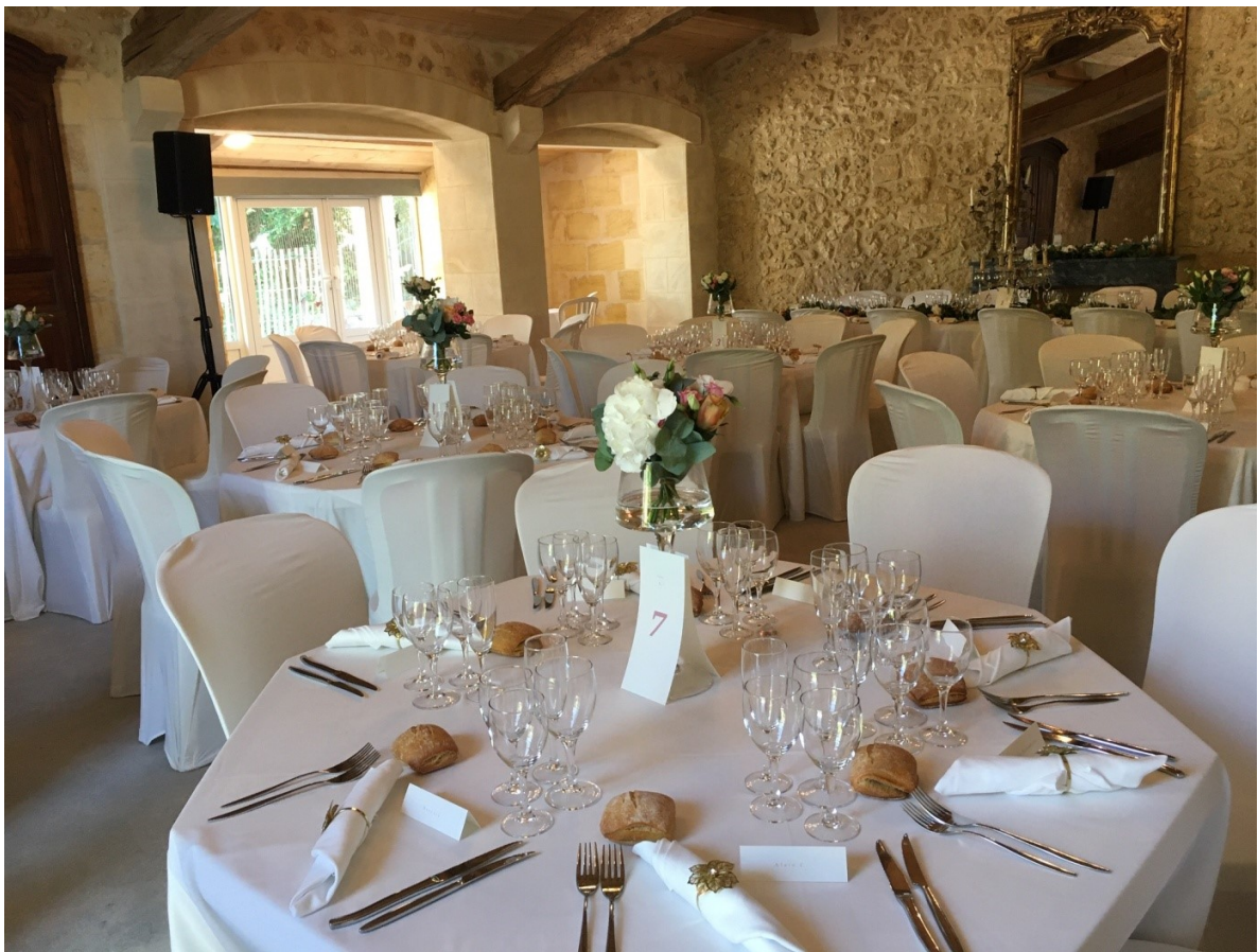
Salle La Grange