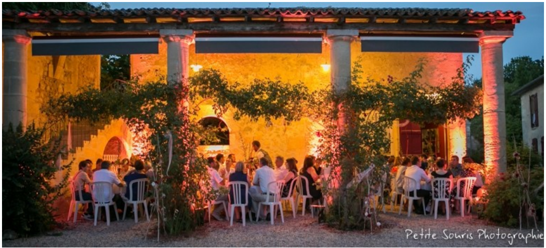
Dîner sous le préau