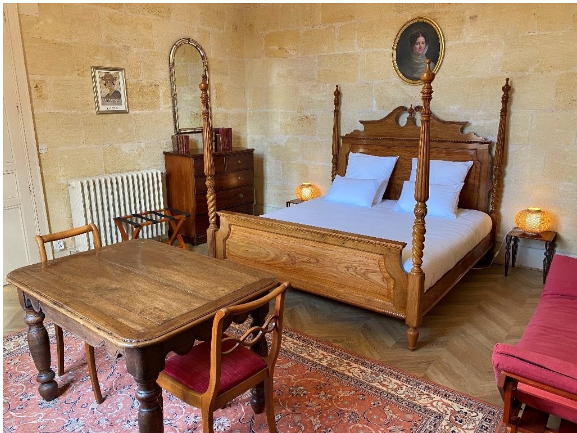
Chambre nuptiale "L'évêque", lit King size