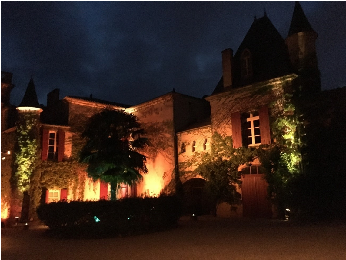
Dans la cour de Sentout