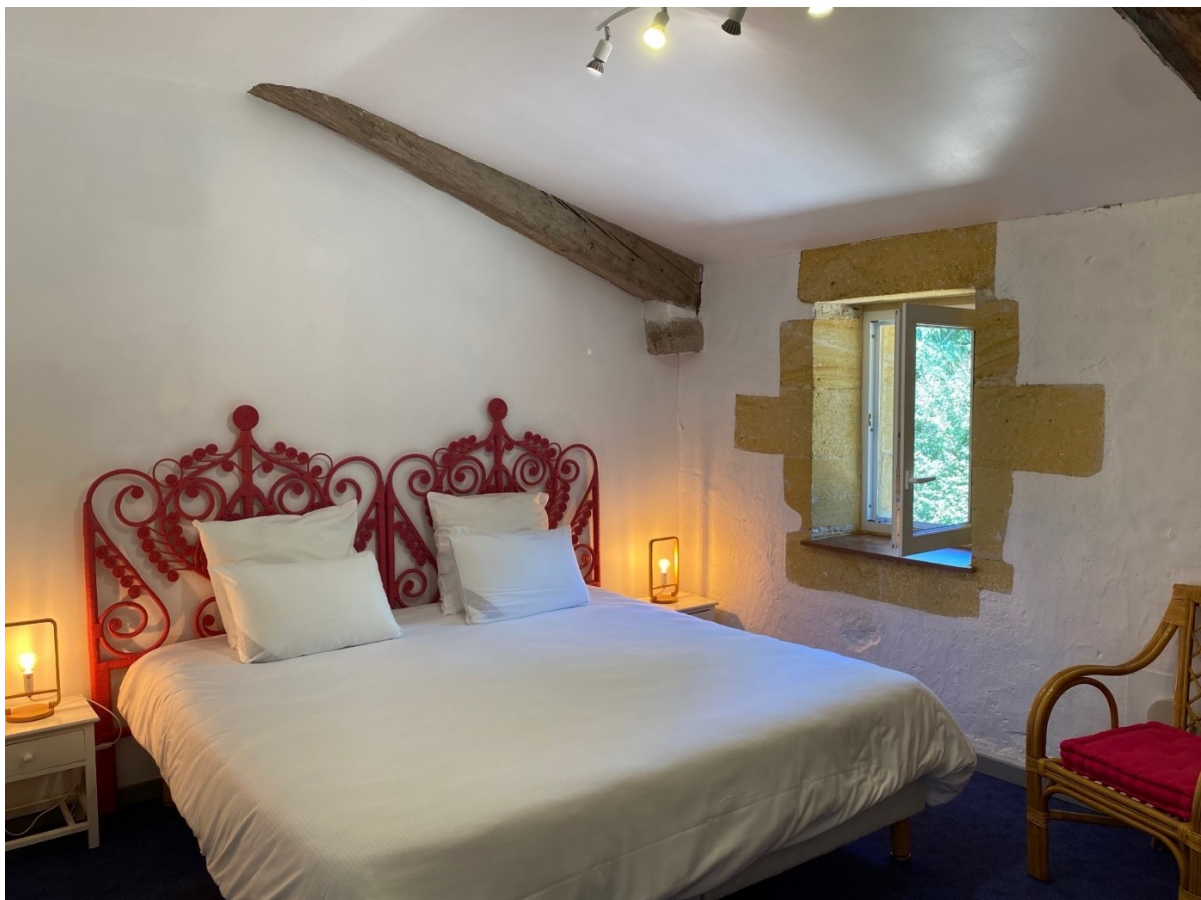
La Tuilerie, lit King size