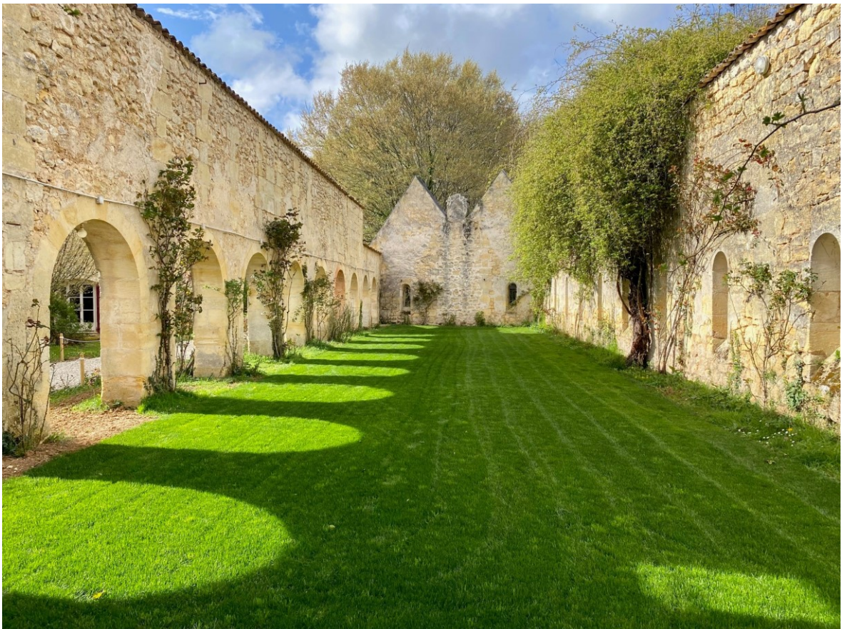
Les arcades du cloître