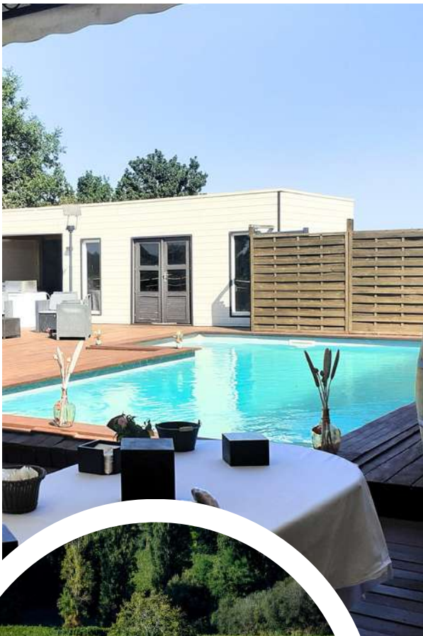
Vue et piscine