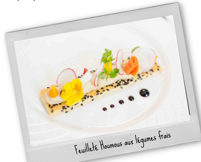
Feuilleté Houmous aux légumes frais