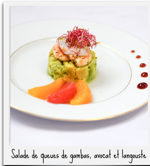
Salade de queues de gambas, avocat et langouste