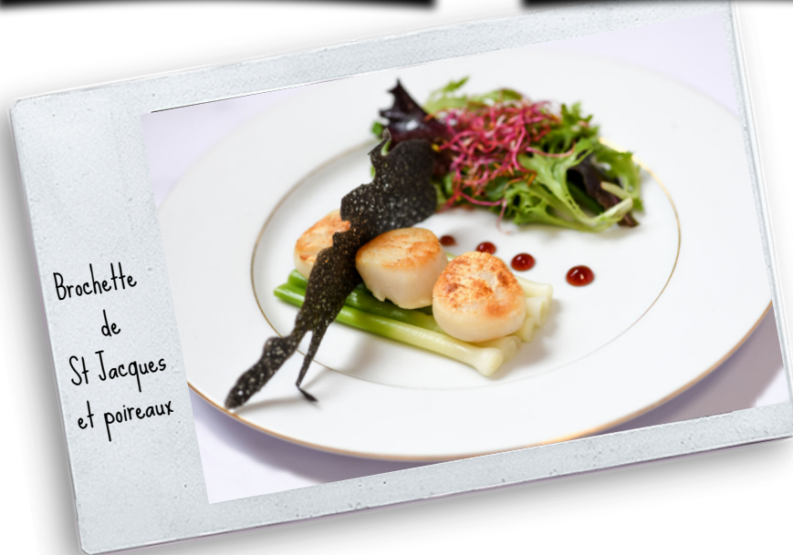
Brochette de St Jacques et poireaux