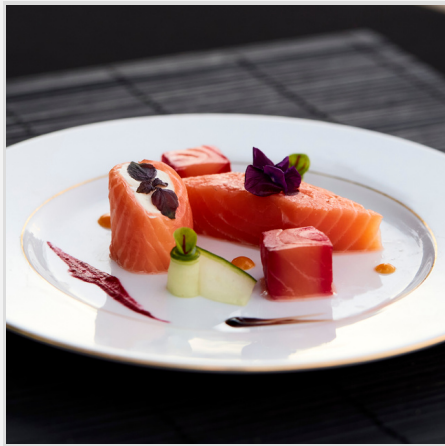
Alternance de saumon