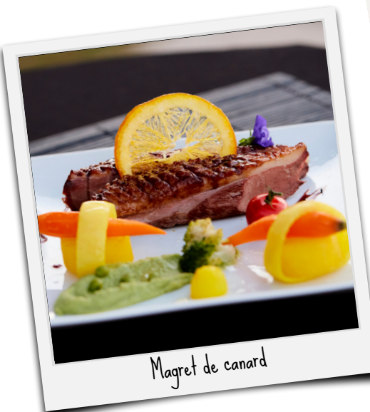
Magret de canard