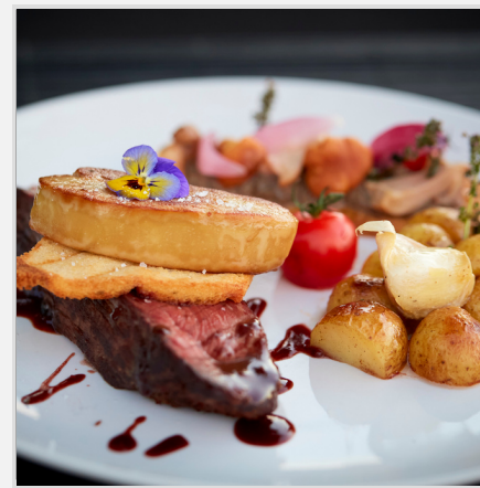
Filet de boeuf Rossini